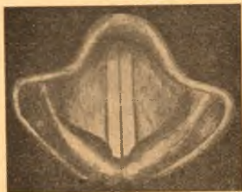
Otwór krtani podczas wymawiania głosek dźwięcznych (samogłosek i spółgłosek dźwięcznych).

230. Czy spółgłoska ch jest dźwięczna czy bezdźwięczna? Odpowiedź napisz.