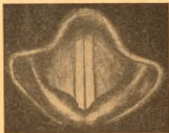
Otwór krtani podczas wymawiania głosek dźwięcznych (samogłosek i spółgłosek dźwięcznych).

§ 32. Jeżeli zatkamy dłońmi szczelnie uszy i będziemy wymawiali kolejno brzmienia spółgłosek s—z , sz—ż , c—dz , cz—dż , to przy wymawianiu z , ż , dz , dż odczuwamy w uszach silne dudnienie, czego przy wymawianiu spółgłosek s , sz , c , cz nie wyczuwamy.