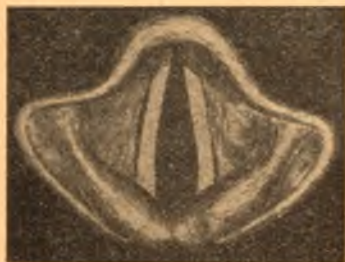
Otwór krtani podczas wymawiania spółgłosek bezdźwięcznych.

229. Jakie spółgłoski bezdźwięczne odpowiadają spółgłoskom dźwięcznym b , d , g ?